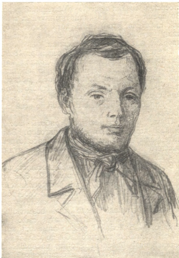
Ф. М. Достоевский. С рис. К. А. Трутовского. 1847 г.