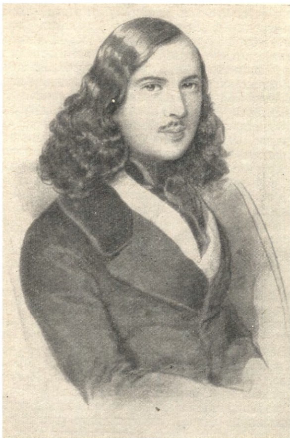
Н. А. Спешнев.